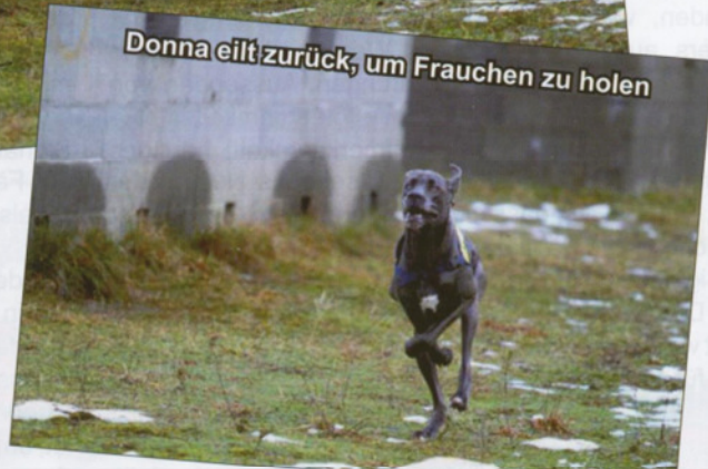
Donna eilt zurück, um Frauchen zu holen