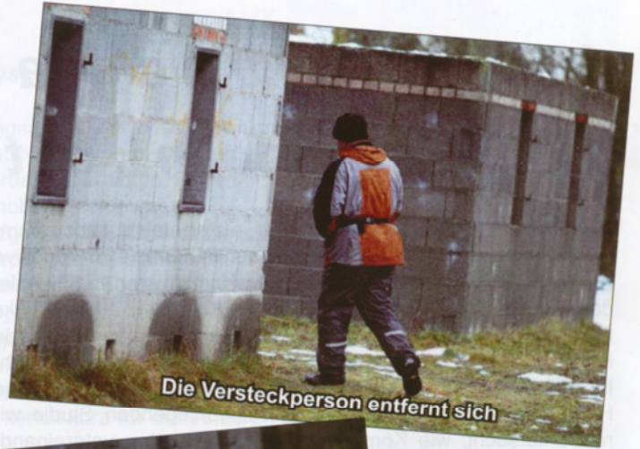
Die Versteckperson entfernt sich