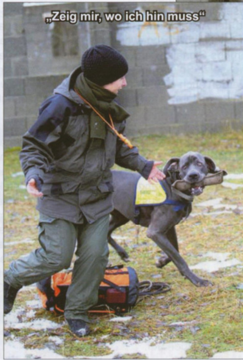
„Zeig mir, wo ich hin muss“