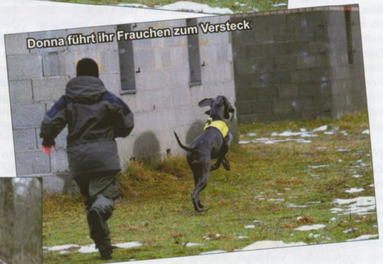
Donna führt ihr Frauchen zum Versteck